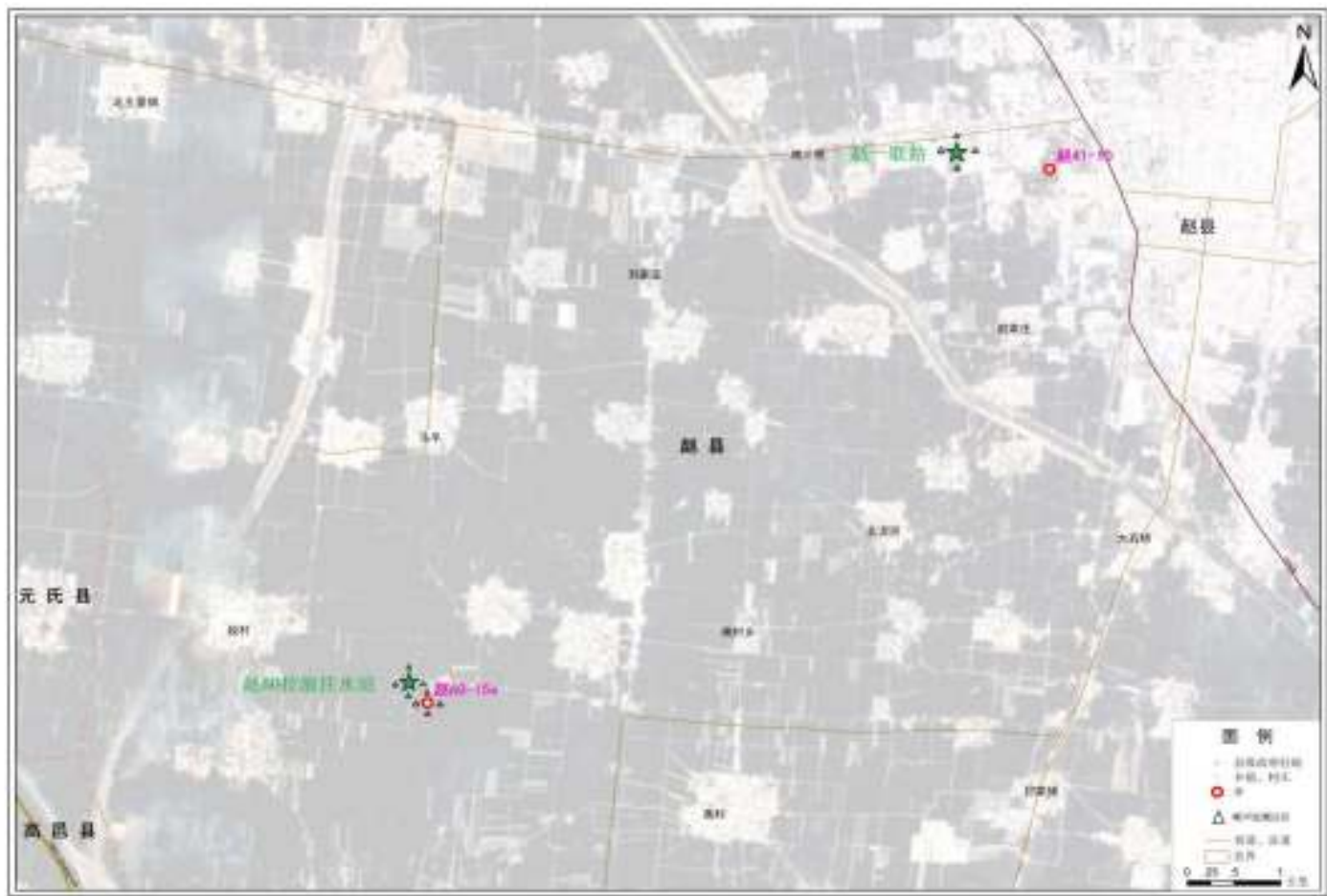
附图2 验收监测布点图（噪声）