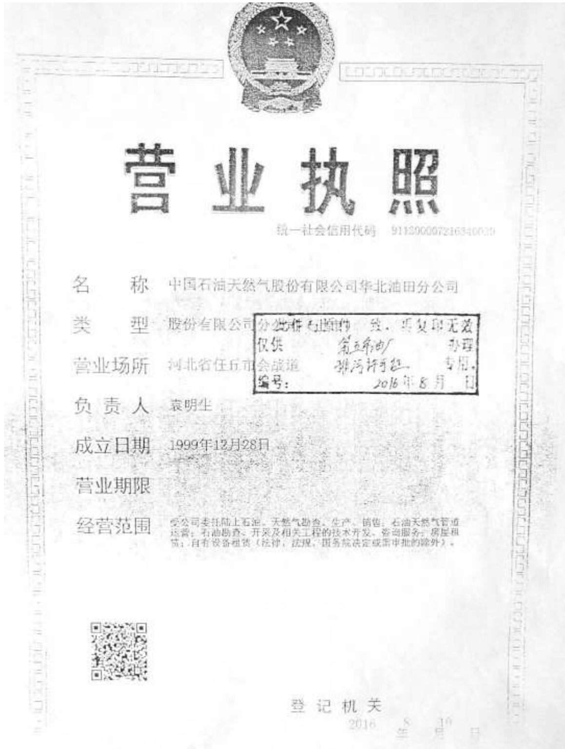
附件 1 企业营业执照