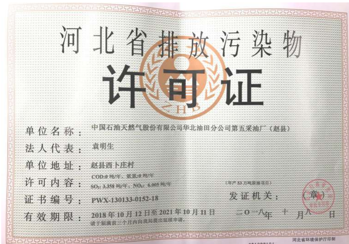
附件 6 排污许可证